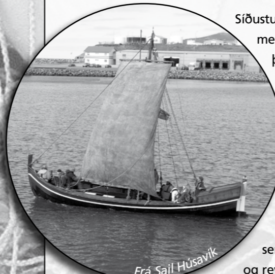
Frá Sail Húsavík