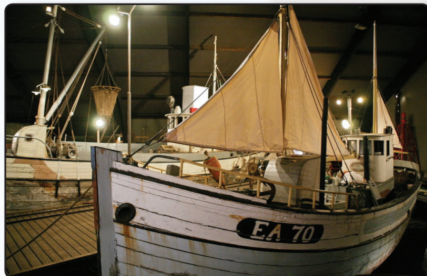
Sildarminjasafnið á Siglufirði