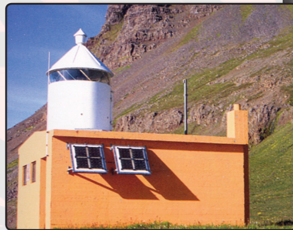
Kópanesviti og skipbrotsmannaskýlið.