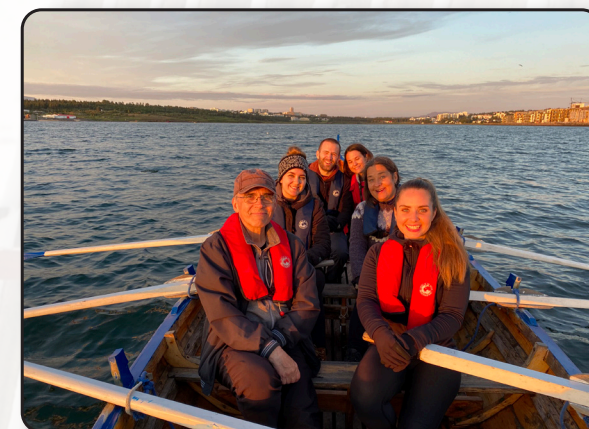
Kvöldróður í Skerjafirði

Frá fyrsta degi hefur Brandur notið þeirrar góðvildar Faxaflóahafna að fá vetursetu fyrir bátana innanhúss yfir veturinn og verður sá velvilji seint nógu vel þakkaður enda hentar íslenski veturinn hinni fingerðu smíði færeysku bátanna ekkert sérlega vel.