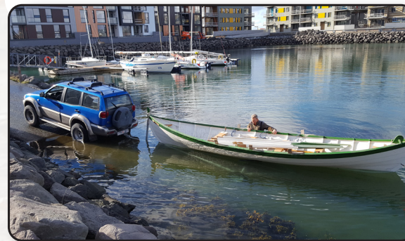
Jötunn sjósettur í Kópavogi