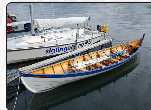
Gammur við festar í Kópavogi

Vinsamlegast munið að greiða félagsgjöldin