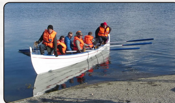
Komið að landi í Nauthólsvík á Svaninum

Færeysku sexæringana Gamm og Jötunn fékk Sjómannadagsráð frá Færeyjum, en ekki er vitað um aldur bátanna. Félagsmenn í Brandi hafa getið sér til að þeir hafi verið smíðaðir fyrir að minnsta kosti 40 árum. Bátarnir voru ásamt nokkrum systurbátum þeirra lengi vel notaðir í kappróðri í Reykjavíkurböfn á Sjómannadaginn, en ekki hreyfðir þess á milli. Kappróðurinn lagðist af fyrir nokkuð mörgum árum og voru bátarnir í geymslu hjá Sjómannadagsráði engum til gagns.