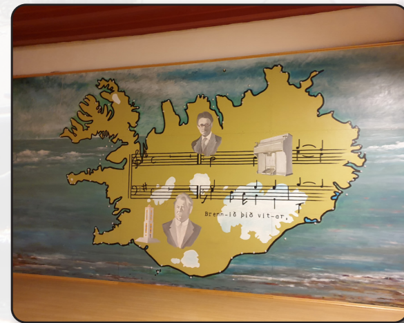
Í menningarhúsinu á Stokkseyri er vísir að Tónminjasafni. Þar er 30 fm. Íslandskort með merkingum á 106 vitum í kringum landið. Merkingarnar eru rafvæddar og kviknar á þeim undir tónverki Páls Íslólfssonar, Brennið þið vitar.