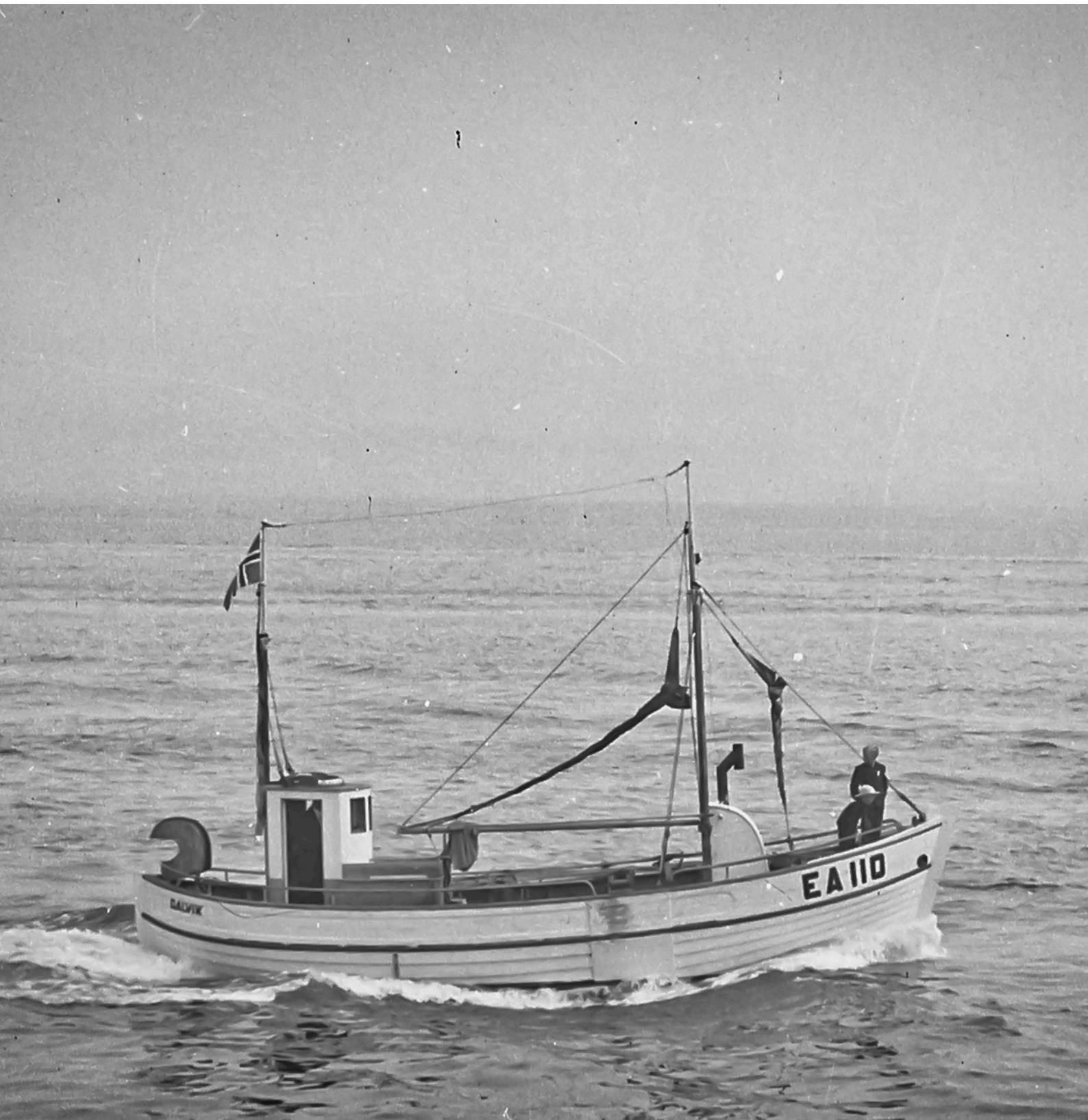
Valur EA 110